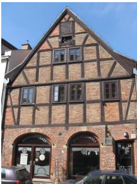
18. Spichlerz pod Jeleniem przy ul. Grodzkiej - budynek z XVIII stulecia