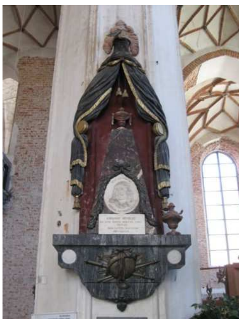
5. Epitafium Jana Heweliusza