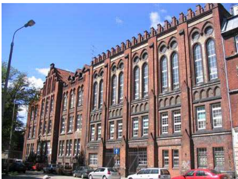
15. Zabytkowa zabudowa dzielnicy Osiek