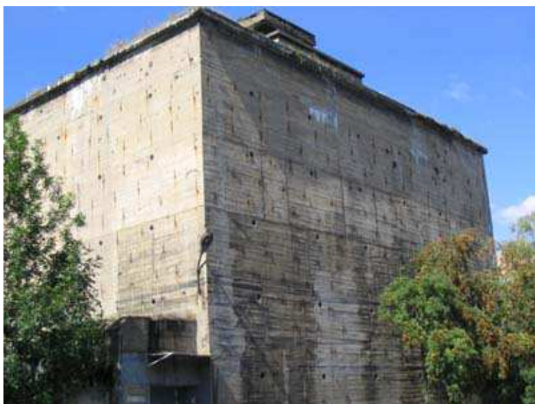
13. Gigantyczny schron przeciwlotniczy z okresu II wojny światowej