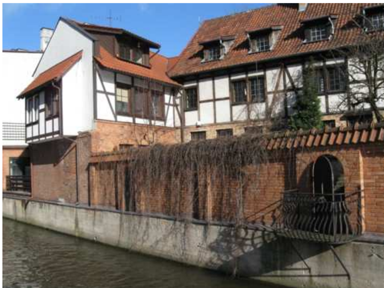
7. Malowniczy fragment Starego Miasta