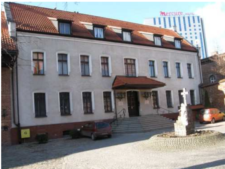
8. Plebania kościoła św. Brygidy – miejsce spotkań antykomunistycznej opozycji