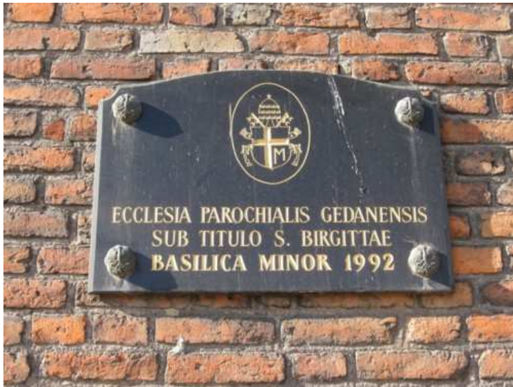
10. W 1992 roku kościół św. Brygidy wyróżniony został tytułem bazyliki mniejszej