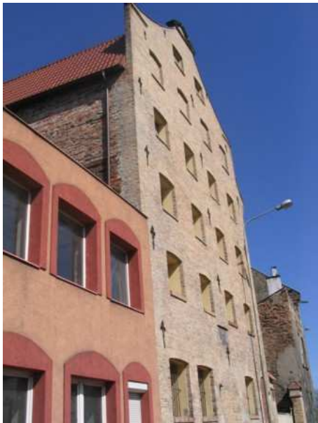
17. Zabudowa tzw. Zamczyska