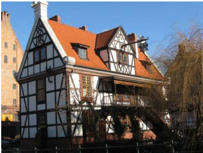
3. Zrekonstruowany Dom Młynarza