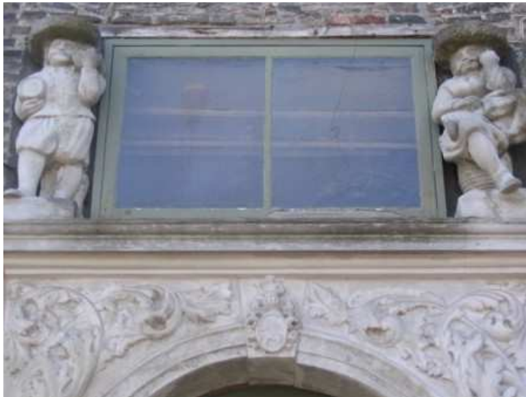
16. Autentyczny portal z piwowarami