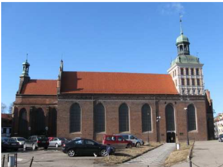
9. Kościół św. Brygidy - duchowe centrum Solidarności