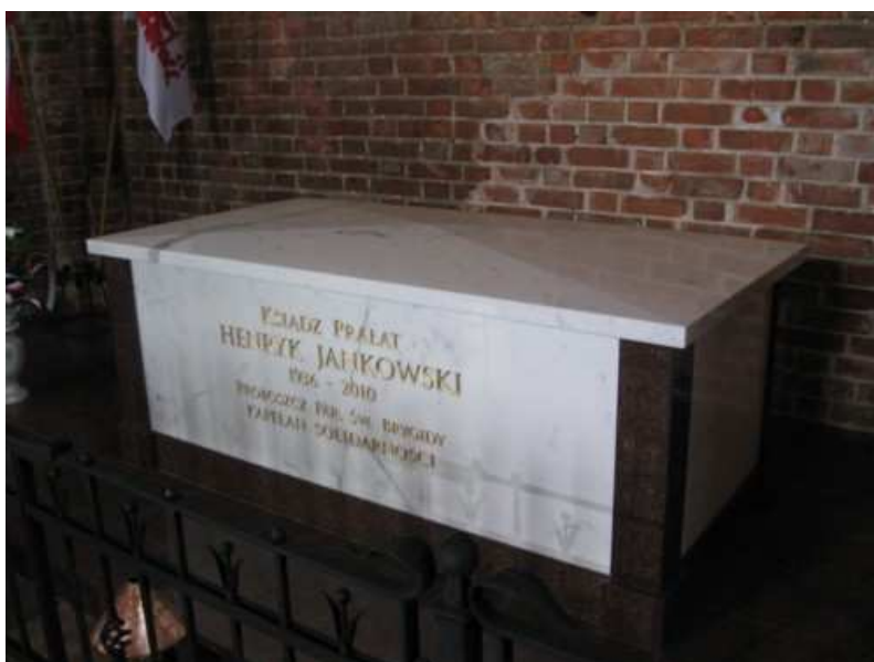
12. Grób ks. Henryka Jankowskiego