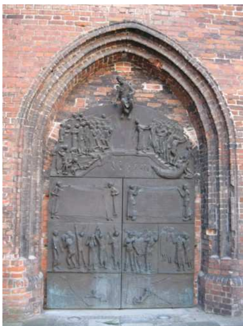
11. Misternie rzeźbione wrota - opis dziejów Solidarności