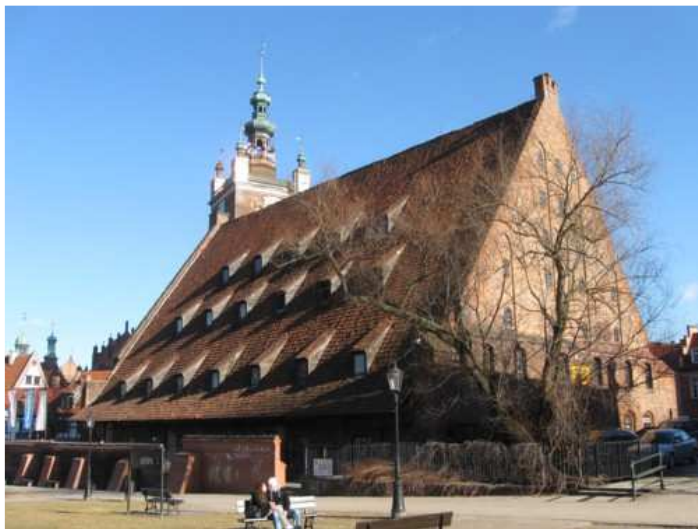
2. Wielki Młyn - największy młyn średniowiecznej Europy!