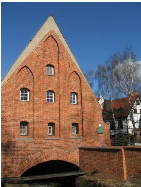
4. Mały Młyn