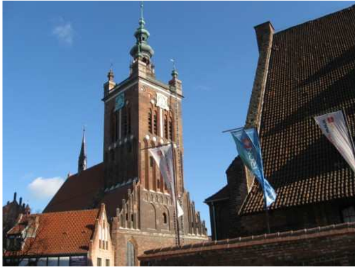
1. Kościół św. Katarzyny - najstarsza parafialna świątynia w Gdańsku