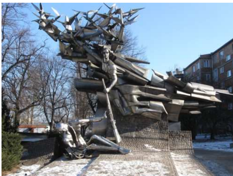
14. Pomnik Obrońców Poczty Polskiej